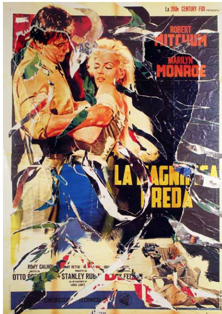
Tecnica: Décollage (110 x 80 cm)