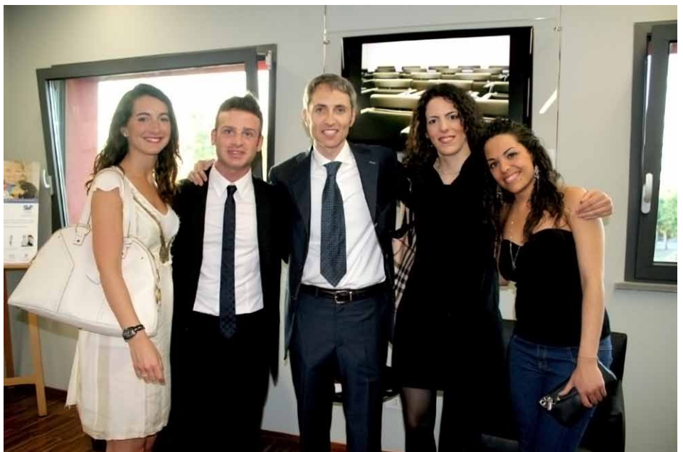
LO STAFF DEL REPARTO DI PREVENZIONE ORALE E STILI DI VITA