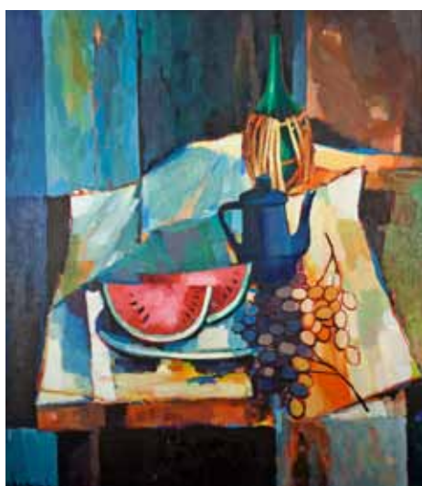
ARMIDO DELLA BARTOLA