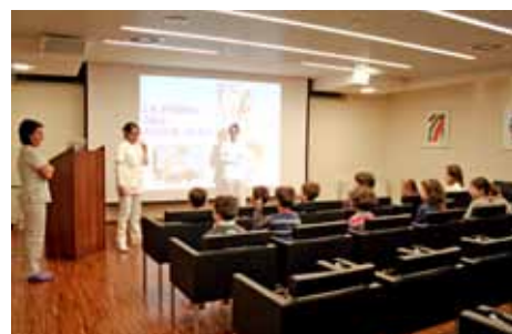
Il gruppo dei piccoli pazienti durante la lezione a Rimini.