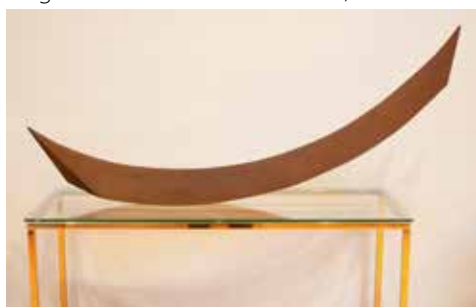
opera esposta nella sala d'attesa della Clinica Merli